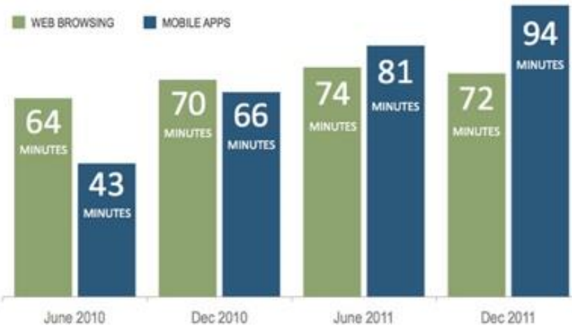
U.S. MOBILE APPS VERSUS WEB CONSUMPTION

É a tecnologia com mais rápida adoção . E as pessoas usam mais apps do que navegam na web.