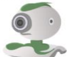
Atividades via web