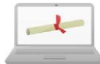
Tele - educação