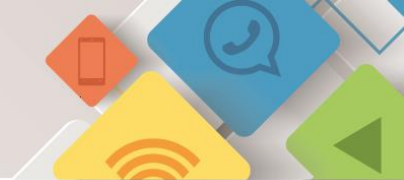
Comunidade Acadêmica Federada - CAFe