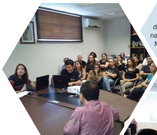
Foto à esquerda, Mês de Segurança 2013 na IF-Sertão e abaixo, Mês de Segurança 2013 no MAST

Envie as ações e fotos das ações na sua instituição para: meseg@rnp.br