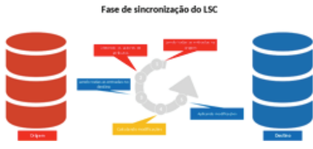
Modelo de sincronização usado pelo LSC.